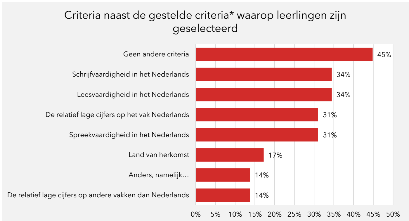
Figuur 2.1 Leerlingen zijn met name geselecteerd op basis van de gestelde voorwaarden aan de regeling

* Maximaal zes jaar Nederlands onderwijs gevolgd en een andere moedertaal dan Nederlands