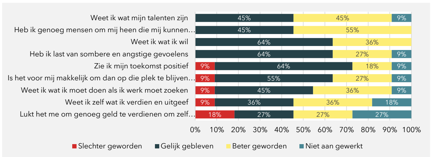
Figuur 3.3 Na mijn tijd bij de Kandidatenmarkt... (algemene stellingen, N=11)