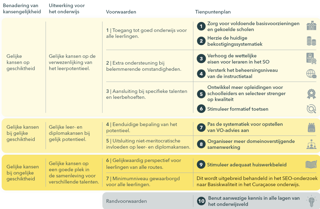
Figuur 6.1 Tienpuntenplan gekoppeld aan het model-Elffers voor kansengelijkheid in het onderwijs