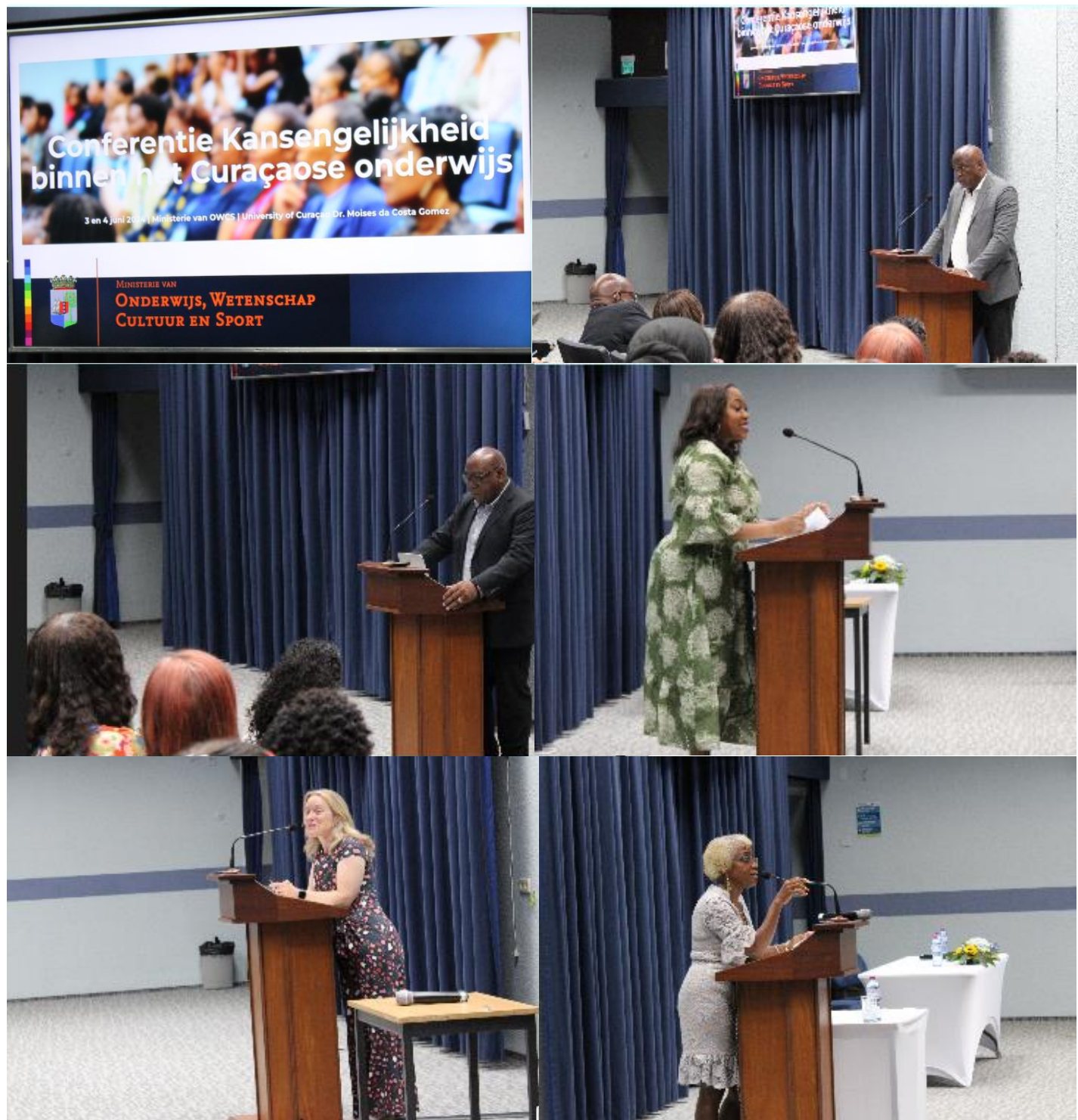
Foto impressie van de conferentie