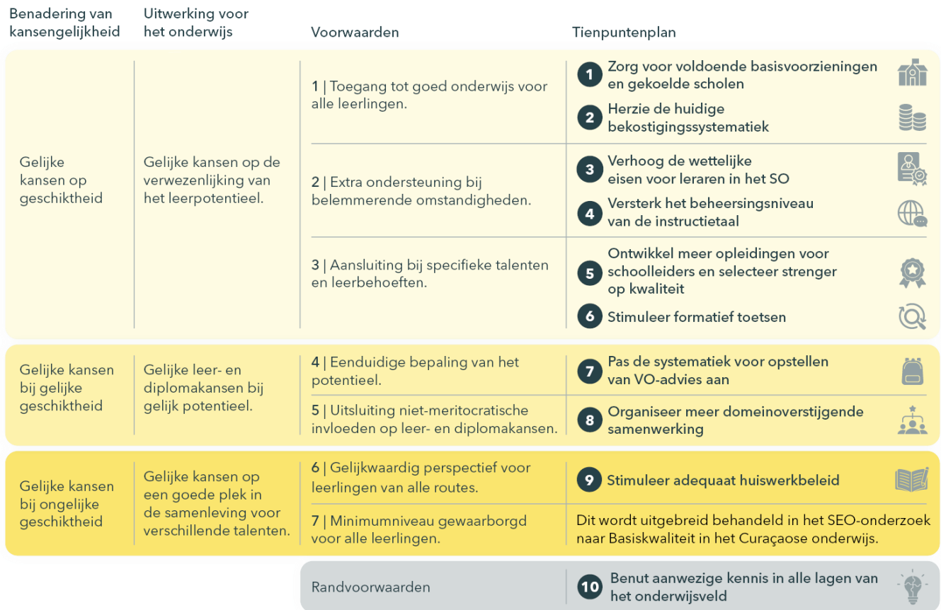
Figuur S.1. Tienpuntenplan gekoppeld aan het model-Elffers voor kansengelijkheid